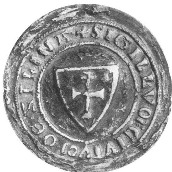
Pečať mesta Žilina