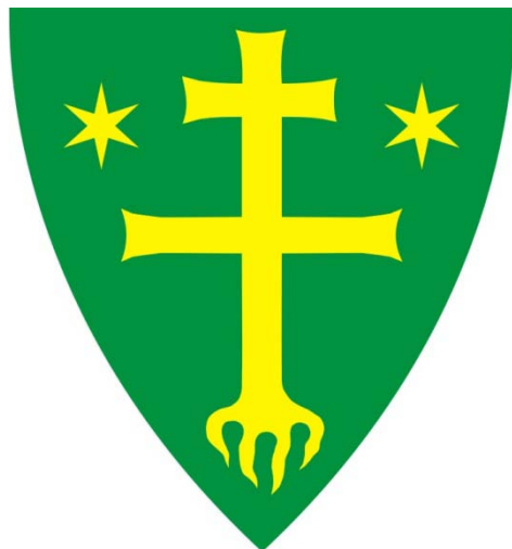
Erb mesta Žilina