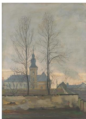
Kostol sv. Barbory v Žiline (olej, 1926, v majetku SNG)

Výber z diela - oltárny obraz svätých Cyrila a Metoda v kaplnke v Závodí či výzdoba dnes už zničenej Kaplnky sv. Jozefa robotníka na Kysuckej ceste pri Slovene.