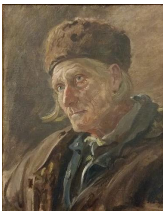
Gazda (olej, 1924, v majetku mesta Žilina)